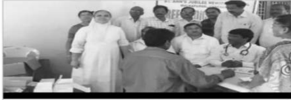
రోగులను పరీక్షిస్తున్న వైద్యులు