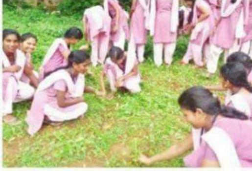
కలుపు మొక్కలను తొలగిస్తున్న విద్యార్థులు