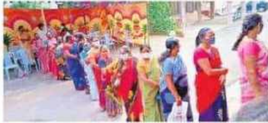
వైద్య పరీక్షలకు బారులు తీరిన జనం