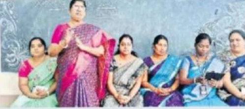
మాట్లాడుతున్న ఎన్ఎన్ఎన్ అధికారి భాగ్యలక్ష్మి