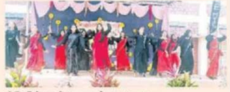
ఫేరీవెల్ సేనువలో పుష్కరాలు చేస్తున్న విద్యార్థులు