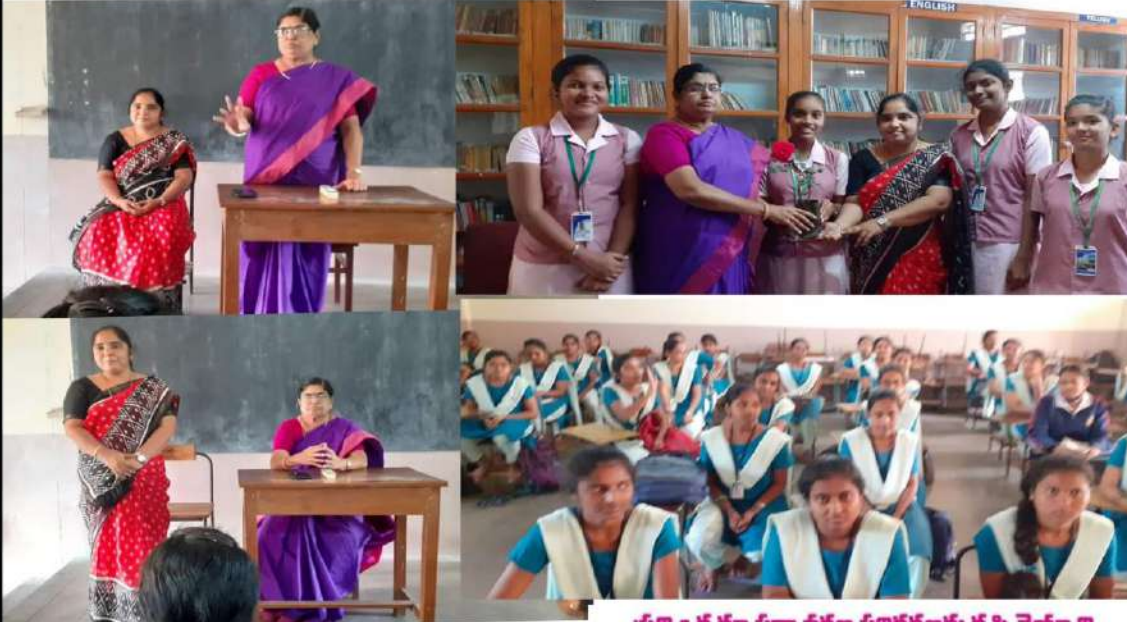
ప్రతి ఒక్కరూ పర్యావరణ పరిరక్షణకు కృషి చెయ్యాలి..