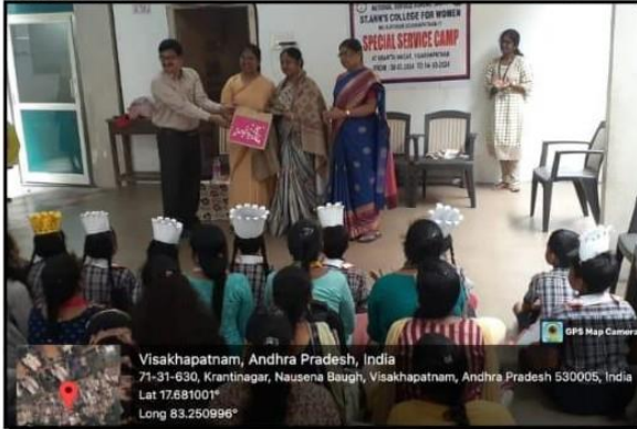
Visakhapatnam, Andhra Pradesh, India 71-31-630, Krantinagar, Nausena Baugh, Visakhapatnam, Andhra Pradesh 530005, India Lat 17.681001° Long 83.250996°