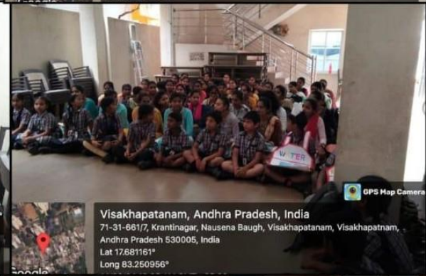
Visakhapatnam, Andhra Pradesh, India 71-31-661/7, Krantinagar, Nausena Baugh, Visakhapatnam, Visakhapatnam, Andhra Pradesh 530005, India Lat 17.681161° Long 83.250956°