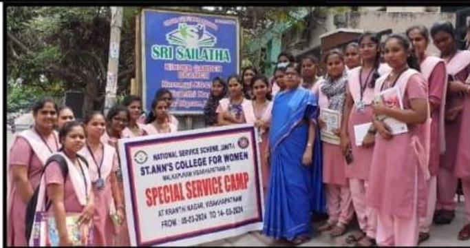
Visakhapatnam, Andhra Pradesh, India 71-31-641, Krantinagar, Nausena Baugh, Visakhapatnam, Andhra Pradesh 530005, India Lat 17.680919° Long 83.251822° 09/03/24 12:46 PM GMT +05:30