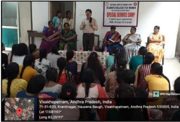
Visakhapatnam, Andhra Pradesh, India 71-31-633, Krantinagar, Nausena Baugh, Visakhapatnam, Andhra Pradesh 530005, India Lat 17.681151° Long 83.25111°