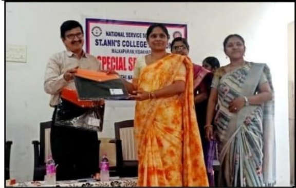
Visakhapatnam, Andhra Pradesh, India M7J2+M77, Nausena Baugh, Visakhapatnam, Andhra Pradesh 530005, India Lat 17.681505° Long 83.250844° 14/03/24 11:33 AM GMT +05:30