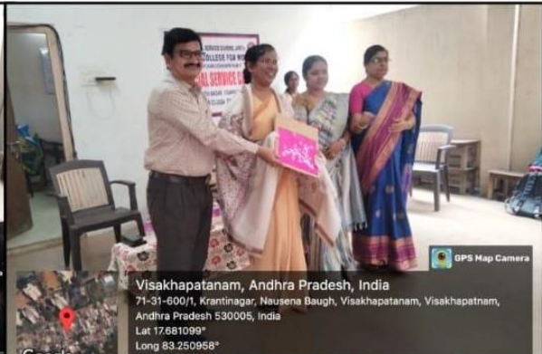
Visakhapatnam, Andhra Pradesh, India 71-31-600/1, Krantinagar, Nausena Baugh, Visakhapatnam, Visakhapatnam, Andhra Pradesh 530005, India Lat 17.681099° Long 83.250958°